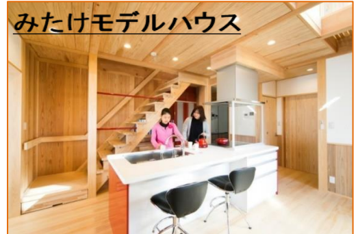
みたけモデルハウス