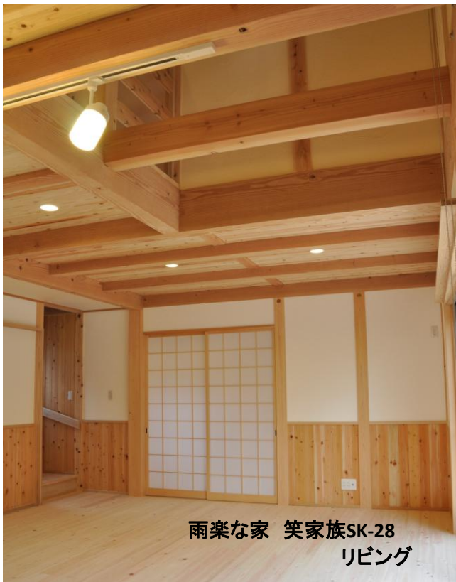
雨楽な家 笑家族SK-28 リビング