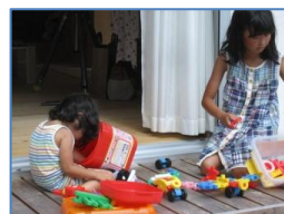
ウッドデッキは子どもの遊び場